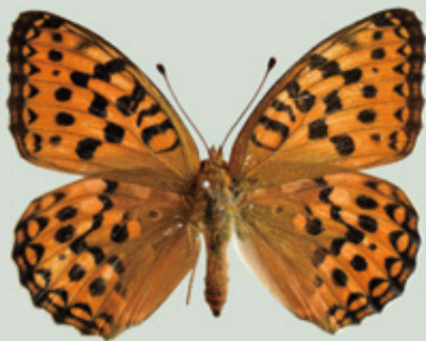
ギンボシヒョウモン