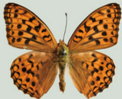
ウラギンヒョウモン