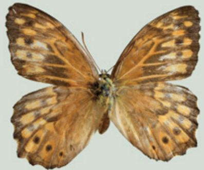
サトキマダラヒカゲ