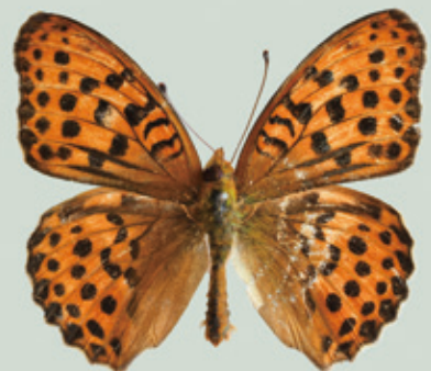
ウラギンスジヒョウモン