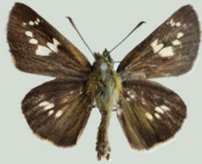
オオチャバネセセリ