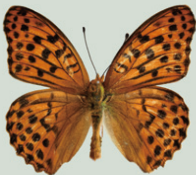
オオウラギンスジヒョウモン