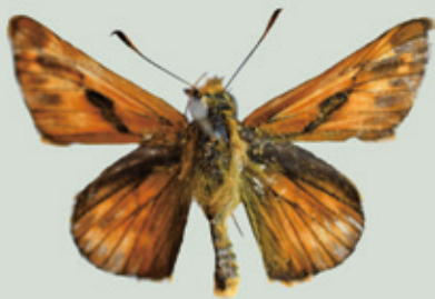
コキマダラセセリ