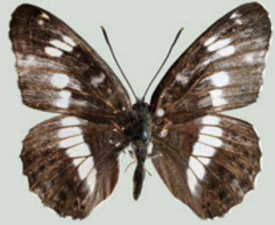
イチモンジチョウ