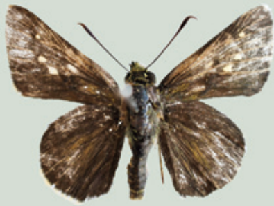
コチャバネセセリ