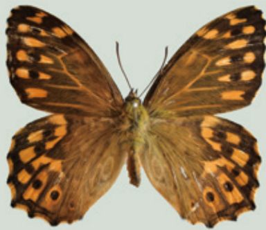
ヤマキマダラヒカゲ