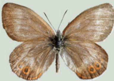
シロオビヒメヒカゲ