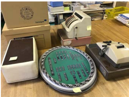
閉店した床屋さんに関する資料

6月10日(土) 10:00~18:00 ▼ 7月9日(日) 場所:博物館ロビー